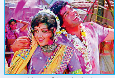
'शोले' में मस्ती के रंग में धर्मेद-हेमा

स्टार्स ने खूब बिखरे होली के रंग : फिल्मों में होली का रंग बिखरने में स्टार्स खूब आगे रहे। इनमें अमिताभ-रेखा पर फिल्माया गया गीत 'रंग बरसे भीगे चुनर वाली' आज भी याद किया जाता है। इस गीत के लंबे समय बाद अमिताभ ने हेमा मालिनी के साथ 'बागबान' में 'होली खेले रघुवीर' के जरिए एक बार फिर रुपलहे पट्टे को रंगीन किया। अमिताभ, विपुल शाह की 'वक्त' में अक्षय कुमार और प्रियंका चोपड़ा के साथ 'डू मी, फेवर, लेट्स प्ले होली' गाते हुए भी खूब जंचे।