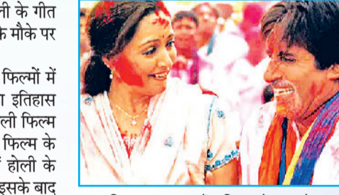
फिल्म 'बागबान' में अमिताभ के साथ हेमा