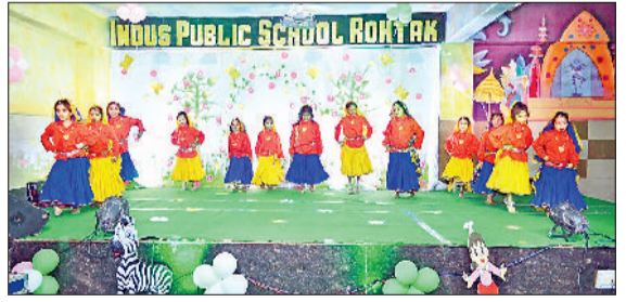
रोहतक। पारितोषिक वितरण समारोह में अपनी प्रस्तुति देते हविद्यार्थी।