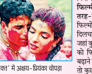
'वक्त' में अक्षय-प्रियंका चोपड़ा

फिल्मी कथा में होली का तरह-तरह से उपयोग: फिल्मों में होली से जुड़ा दिलचस्प पहलू यह भी है कि जहाँ कुछ फिल्मकारों ने होली को फिल्म की कहानी आगे बढ़ाने के लिए उपयोग किया, तो कुछ ने टर्निंग प्वाइंट लाने