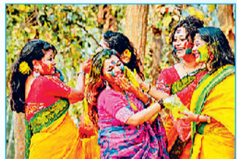
बंगाल की पारंपरिक अबीर होली

बदल गया पर्व का स्वरूप: समय के साथ-साथ होली का स्वरूप बदलता गया और लोग इससे बचने लगे हैं। विकृत स्वरूप के कारण रंगों का चलन कम हो गया है और केवल थोड़े-बहुत अबीर का