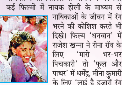
'उर' में सनी देओल-जूही चावला

फिल्मी कथा में होली का तरह-तरह से उपयोग: फिल्मों में होली से जुड़ा दिलचस्प पहलू यह भी है कि जहाँ कुछ फिल्मकारों ने होली को फिल्म की कहानी आगे बढ़ाने के लिए उपयोग किया, तो कुछ ने टर्निंग प्वाइंट लाने