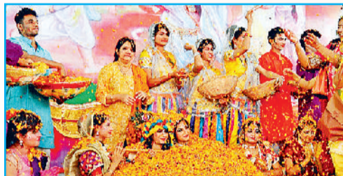
मथुरा में फूलों वाली होली खेलते स्थानीय लोग

समर्पित करने के बाद ही उपभोग करने की परंपरा रही है। यह परंपरा आपसी प्रेम और सौहार्द का प्रतीक है। साथ ही होली में मंत्रोच्चारण के साथ गेहूँ, चने की बालियाँ, नव अन्न के साथ घृत, पुष्प, जड़ी-बूटियाँ, गोबर के उपले, कंडे और सुगंधित द्रव्यों को अग्नि में समर्पित कर वातावरण को शुद्ध, परिष्कृत करके धूम कण बादलों को आमंत्रण देते हैं और वर्षा होती है। साथ ही होलिका दहन से अहंकार, ईर्ष्या और बुराईयों का विसर्जन होकर समूचे परिवेश में सौहार्दता और प्रेम का वातावरण निर्मित होता है।